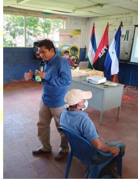
Delegado MARENA RACCS