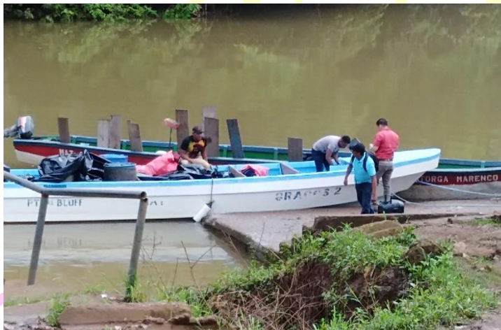
Equipo técnico regional llegando al Tortuguero