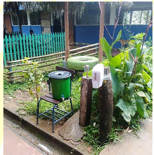
Prevención COVID 19