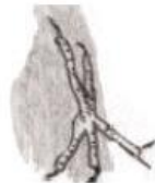
Trepar por los troncos