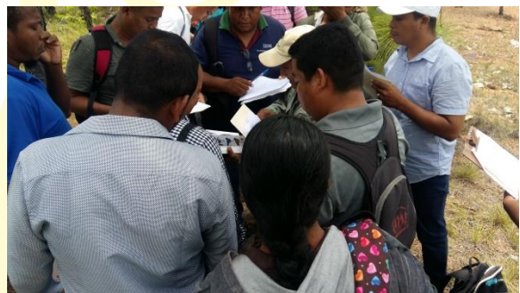
Explicación sobre el uso de guía de aves