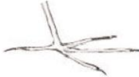
Distribuir el peso sobre la vegetación flotante (en jacanas)