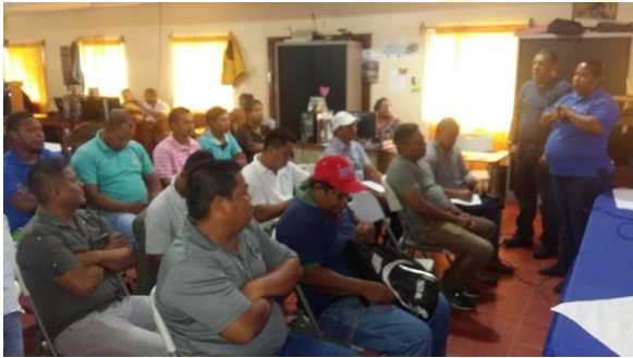
Coordinadora del SERENA dirigiéndose a los asistentes del taller de biodiversidad