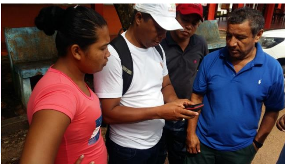
Explicación sobre el uso de GPS