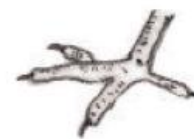
Caminar en el suelo