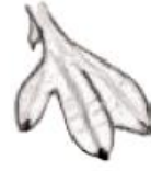
Zambullirse y nadar