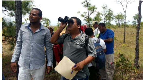
Observación de ave con binoculares