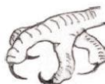
Atrapar presa y cargarla