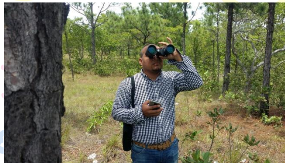
Observación de aves con binoculares