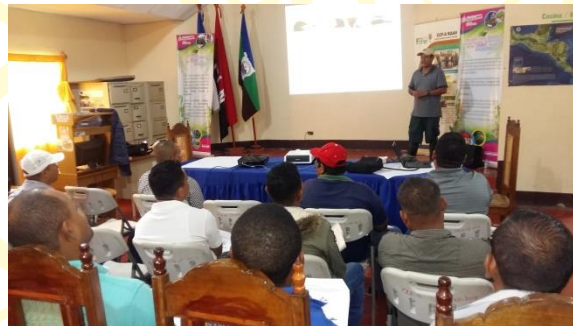
Exposición de la temática a los y las asistentes al taller de biodiversidad