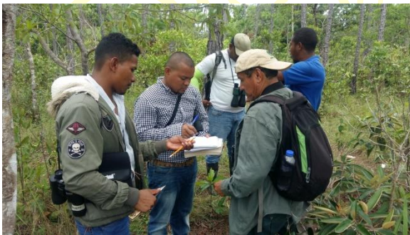
Identificación en campo con guía de aves