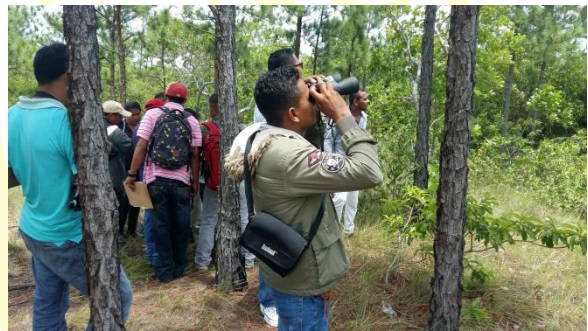
Observación de aves uso de binoculares