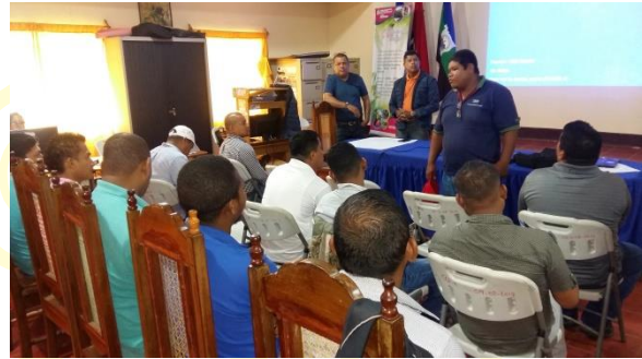
Presentación de participantes al taller de biodiversidad