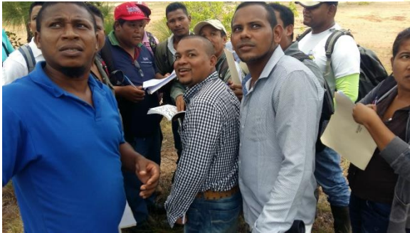
Clase práctica de los asistentes al taller